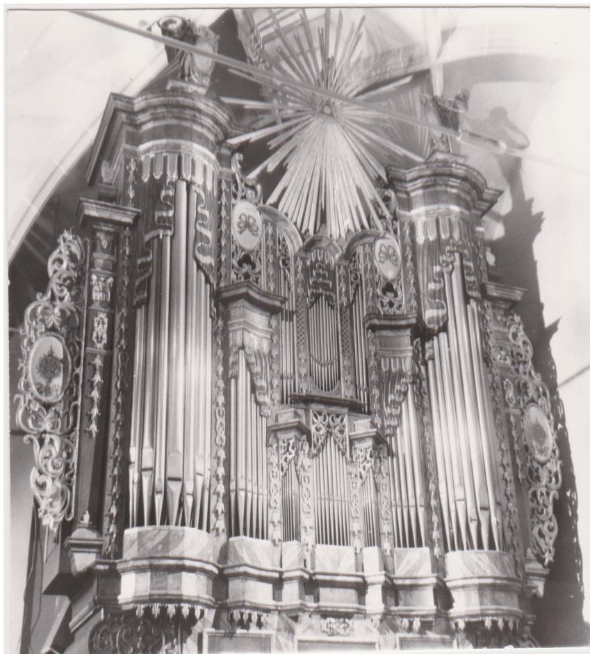
Siménfalva – Református templom

épített, számost közülük református templomokban találunk. Ismertebb hangszerei: Kolozsvár (Szt. Mihály templom – 1753), Kolozsvár (Farkas-utcai templom – 1765), Marosvécs (Református templom – 1757) Legnagyobb orgonáját Medgyesen építette fel 1755-ben.