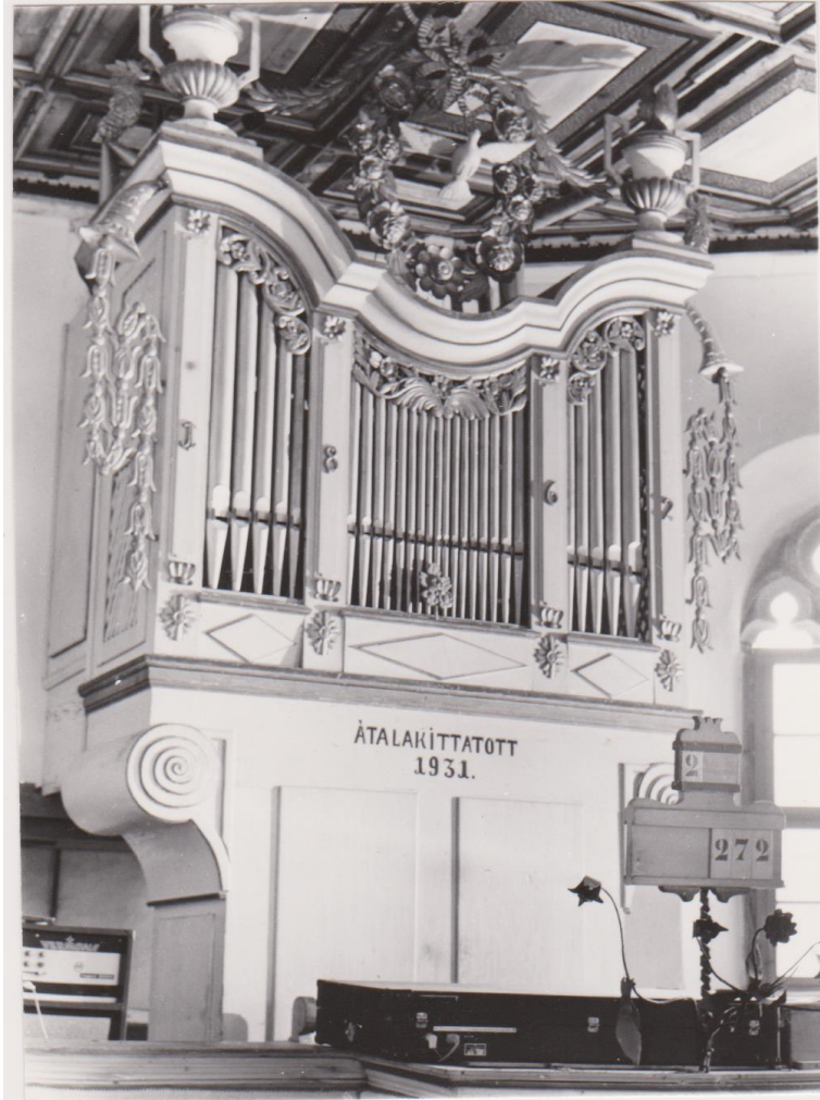
Medgyes – Evangélikus templom

jó rendire megkészítették volt... ezen év November hónapja 10. Napján... fel is szenteltetett.” 7