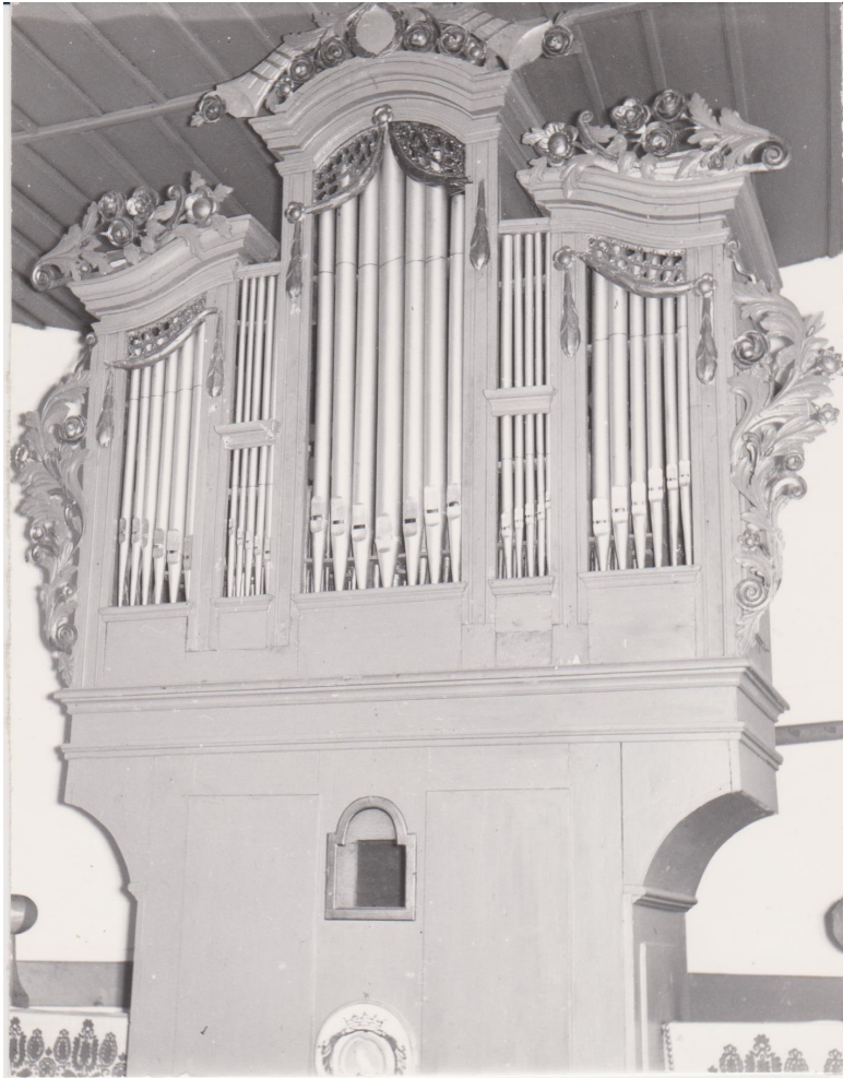
Agyagfalva – Református templom

Segesvárra, 5 fuvart Berethalomba és Százkézdre is egy követnek napidíjat fizettek. A festetlen leszállított, 6 változatú orgonát segesvári mester, Goosz János készítette.” 6