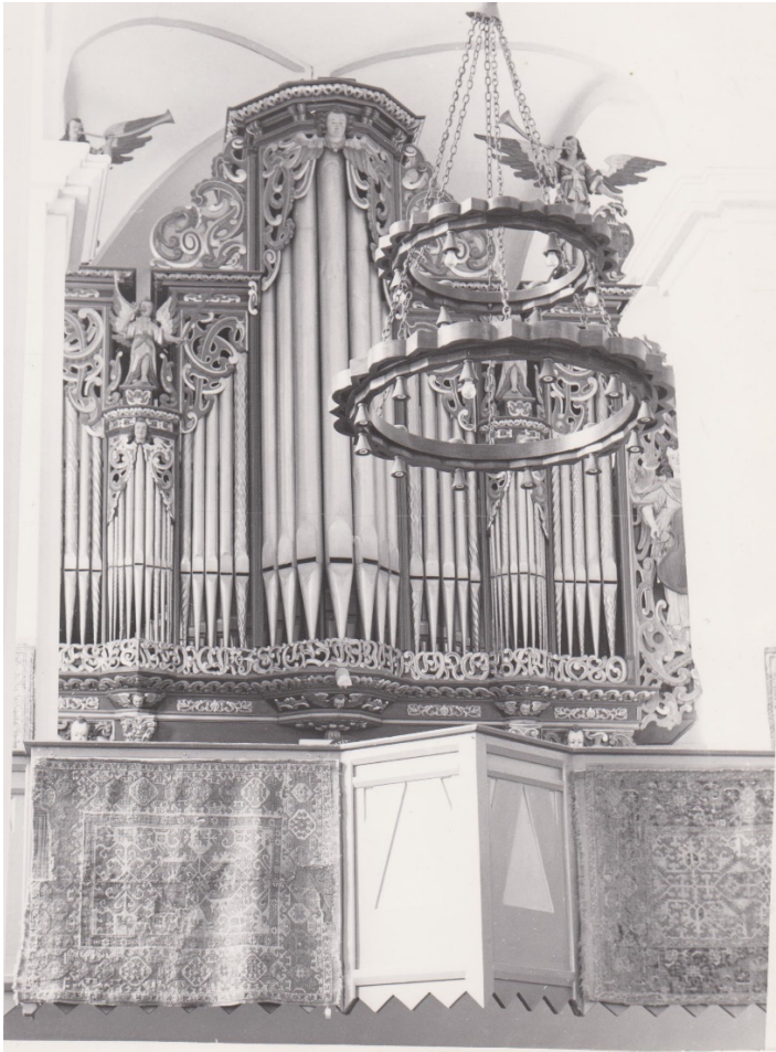
Ádámos – Unitárius templom

A segesvári domonkosok egykori temploma számára (ma Klosterkirche) 1680-ban egy valamivel kisebb orgonát készített, mely megkapó hasonlóságot mutat korábbi munkájával. Mindkét orgona díszes homlokzatát Jeremias Stranovius és Paul Demosch készítették. Vest orgonájának belsejét 1905-ben a Rieger & Jägerndorf cég romantikus stílusban átépítette, homlokzata azonban eredeti állapotában maradt.