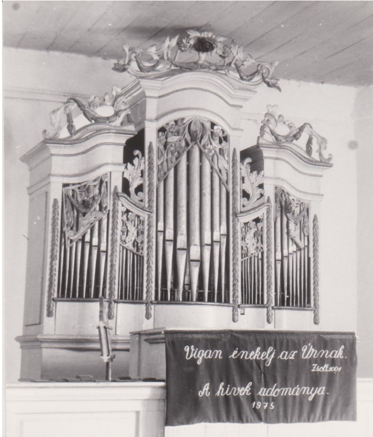
Kolozsvár – Farkas utcai templom