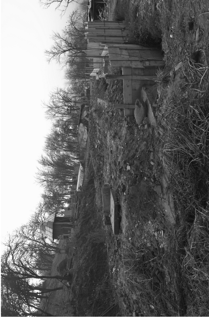
3. Ruinele bisericii din Țaga