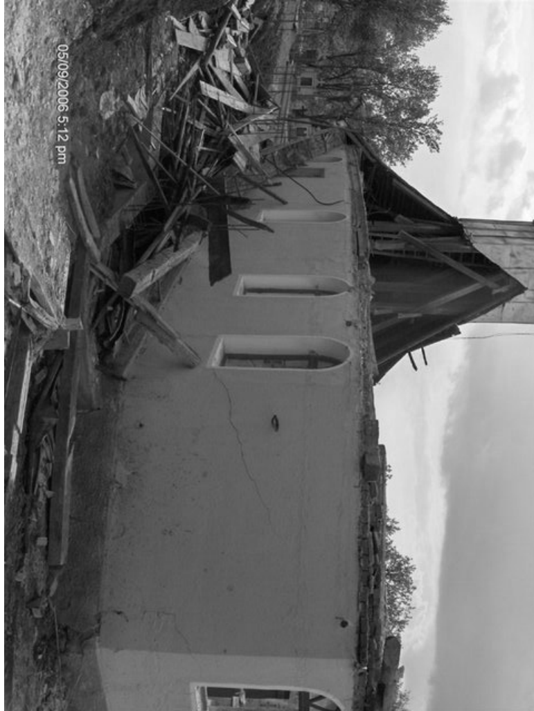
2. Biserica din Tăga în curs de demolare