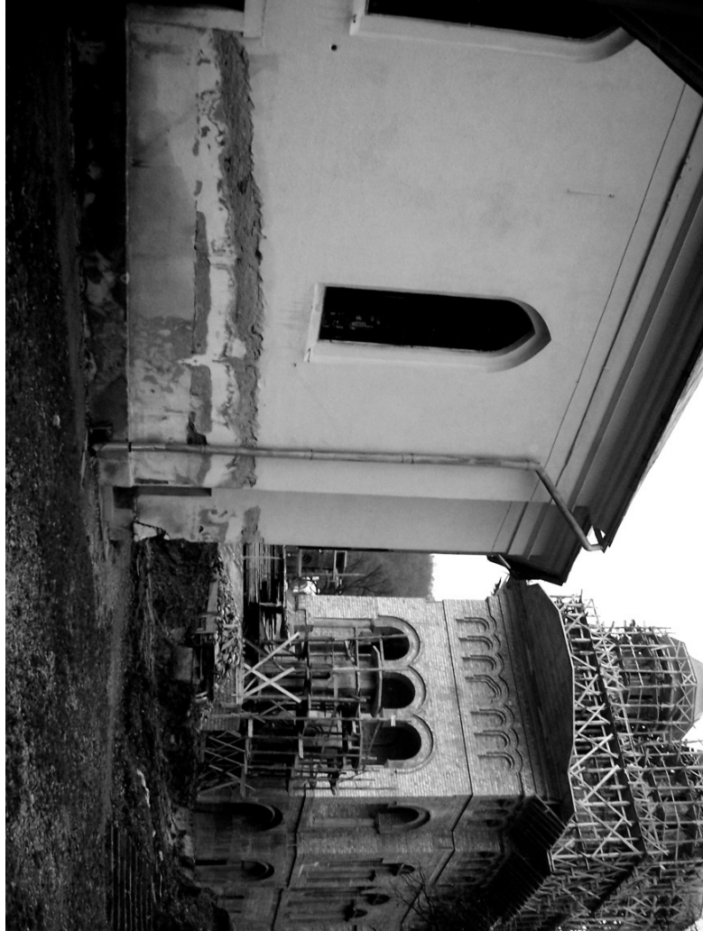
4. Biserica deteriorată de la Nicula alături de biserica nouă, în construcție