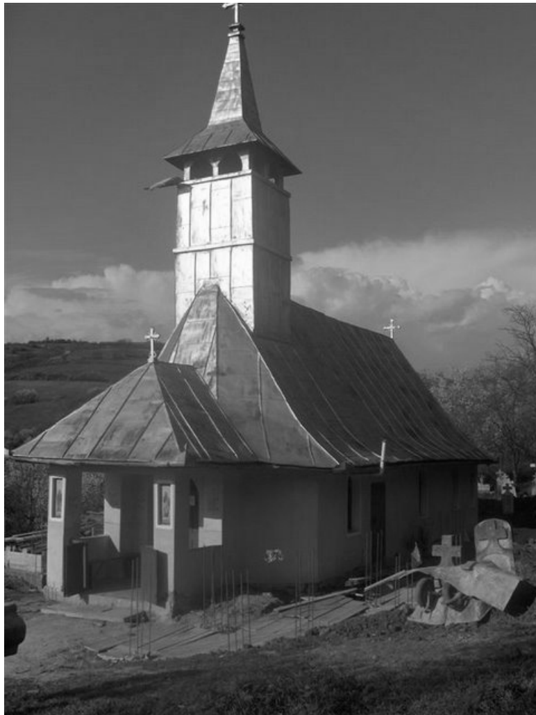
1. Biserica din Țaga înainte de demolare