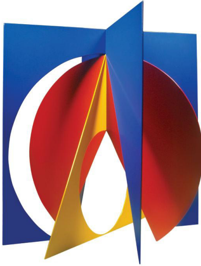
Dinamica formelor și culorilor de bază