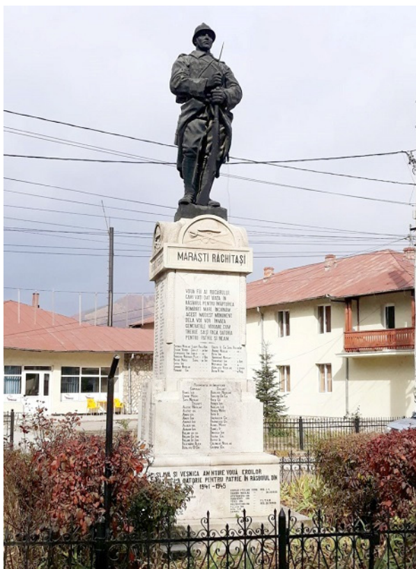
Fig. 8. Dumitru Mățăoanu, Giovanni e Victor Mezzarobba. Monumento dedicato agli Eroi di Rucăr (1924).

Un monumento analogo, raffigurante un milite armato sovrastante un massivo blocco di pietra, venne eretto nello stesso arco di tempo dai Mezzarobba per la natia cittadina di Rucăr (1924). L'opera in bronzo dedicata al combattente è attribuita al noto scultore Dumitru Mățăoanu (Câmpulung Muscel, 1888 – Bucarest, 1929) 37 .