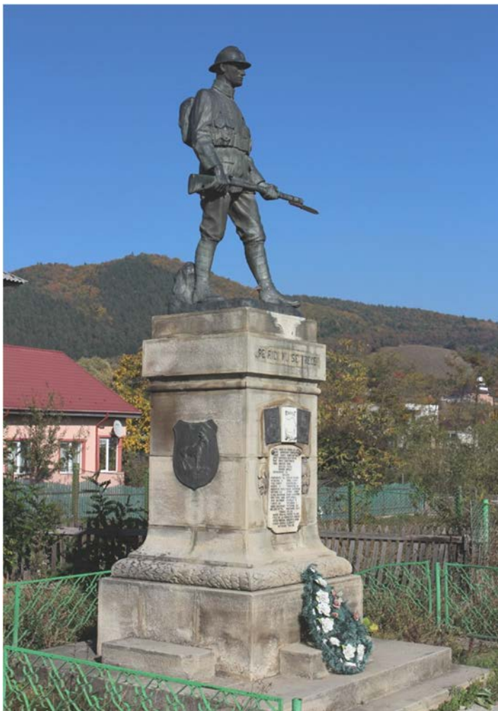
Fig. 11. Mihai Onofrei, Vincenzo Puschiasis. Monumento all'eroe soldato di Viișoara (località Bistrița – județul Neamț, Strada Cuza Vodă, 1926).

Attribuito ai magisteri di Puschiasis è anche il massiccio basamento lavorato del monumento ai caduti della Prima guerra mondiale presente nella piazza di Buhuși nel distretto di Bacău (1925) 48 . Le opere in bronzo sono invece opera dell'artista di origine ceca naturalizzato romeno Ion Schmidt-Faur, nato Iohann Schmidt (Znojmo, 1883 – Bucarest, 1934).