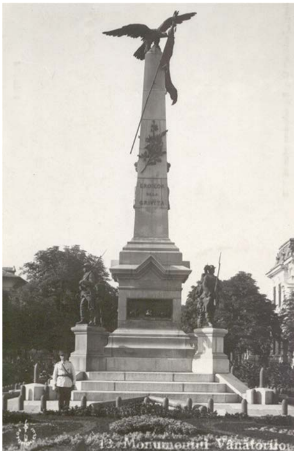
Fig. 2. Domenico Rupolo, Giorgio Vasilescu. Monumento dedicato al II Battaglione cacciatori di montagna ( Monumentul Batalionul II vânători ) sito in Piața 1 Decembrie a Ploiești (1897) in una cartolina del 1935.