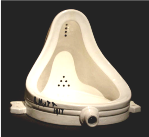
Fig. 1 : Marcel Duchamp, Fontaine , 1917.

ready-made signés par Duchamp. Cette œuvre n'est pas seulement un simple urinoir devenu célèbre par hasard, mais il s'agit d'un objet particulier choisi par l'artiste. Pour Duchamp, c'est bien le choix de l'objet qui est une étape essentielle dans la démarche du ready-made. Ainsi, le choix fonctionne comme une véritable trouvaille autant dire une sorte de rendez-vous : Duchamp affirme que si art veut dire faire , et si faire veut dire choisir , alors art veut dire choisir .