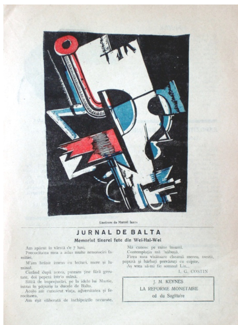
Fig. 1-2. Abstract linoprints by Marcel Iancu in Contimporanul no. 48 and 49.

The compositions turn to account the tensions created between rectangular forms by the horizontal and the vertical lines intersected by the dynamical oblique ones or by curved contours on full white and black surfaces, the idea of a plastic show based only on the resonance of the primary forms being eloquent.