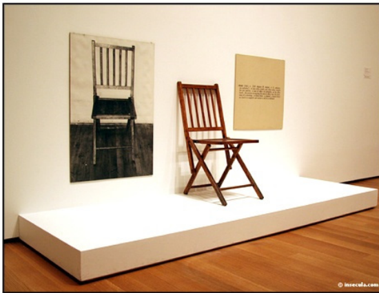
Fig. 2 : Joseph Kosuth, One and three chairs , 1965.

l'exploitation du médium devient sans effet. L'œuvre d'art est devenue d'ordre cognitif et conceptuel puisqu'elle se réduit à l'idée et suscite la réflexion du public. L' œuvre-concept n'appartient pas à l'art ni à la manière d'un tel artiste , elle se définit comme porteuse de sens et suscite des interrogations de la part de celui qui la regarde : « l'art ne revendique que l'art, l'art est une définition de l'art », dit Joseph Kosuth 8 . Cela signifie que l'artiste définit l'art comme activité qui se distingue des autres activités humaines, telles que la religion, la philosophie, la littérature... L'art, selon Kosuth, est la manifestation d'une idée et d'un concept. L'œuvre-concept serait alors le prétexte d'une réflexion et d'une conceptualisation. Kosuth explique son point de vue par son œuvre One and three chairs . Il expose une chaise, une image de la chaise et la définition d'une chaise. L'artiste a représenté un seul objet par trois façons différentes et sans qu'il y ait une répétition.