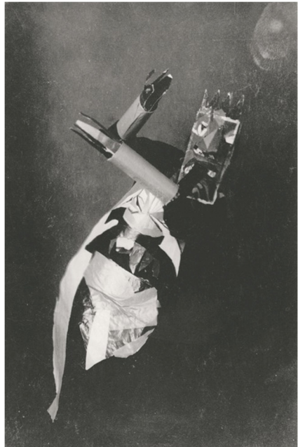
Figure 1: Sophie Taeueber, Marcel Janco, Dancing Mask , 1916.

Instead of tradition, sunlight and wonder operate through her. She is full of invention... bizarreness... The narrative of the perspectives ... dance patterns are full of romantic desire, grotesque and enraptured . 11