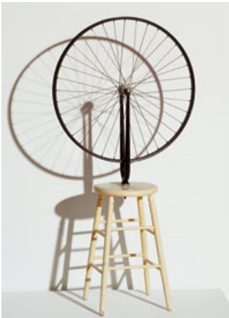
Fig.4 : Marcel Duchamp, Roue de bicyclette , 1913/1964

Pour sa part, Bertrand Lavier expose un réfrigérateur sur un coffre-fort, ce qui nous rappelle la Roue de bicyclette de Duchamp. Cette œuvre envisage un assemblage entre deux objets (tabouret + roue de bicyclette) pour créer un troisième, ce que Duchamp appelle un objet-valise. C'est aussi, selon lui, une sculpture sur socle qui rappelle les sculptures de Brancusi. Mais est-ce que le geste de Lavier est réfléchi, porte-t-il une vision du futur comme c'était le cas pour les ready-mades de Duchamp ?