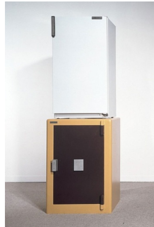
Fig. 5: Bertrand Lavier, Réfrigérateur sur un coffre-fort

En fait, cette stratégie artistique, devenue réputée dans l'art contemporain, réinterprète la démarche de Duchamp, alors que ce dernier se distinguait par une approche visionnaire. Les gestes adoptés par les artistes contemporains semblent dénaturer le sens de la pratique duchampienne. L'art contemporain est ainsi devenu, dans sa totalité, prisonnier du geste de cet artiste emblématique et nous pouvons ainsi dire qu'« il y a désormais des ready-mades partout et de