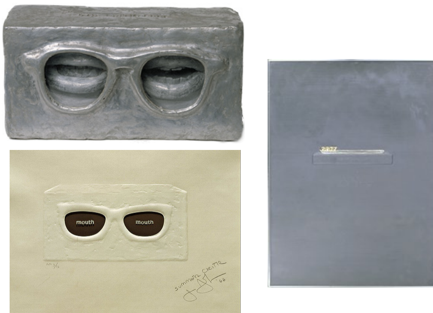
Fig. 12 : Jasper Johns, The critic sees , The critic smiles , Summer critic (1961-1969).

En conclusion, nous dirions que Beckett ne réduit pas le dramatique, il le réinvente, le transfigure (en passant ainsi au sens propre au-delà du figuratif classique devenu impossible). La forme du drame beckettien est le correspondant vivant de la forme plastique que revêt la nouvelle réalité des années 60. Si le théâtral dans un tableau dépend de la capacité de l'artiste de rendre le mouvement ou les effets de mouvement, chez Beckett la théâtralité est étroitement liée aux efforts dans la direction du mouvement, aux envols brisés, aux élans coupés, à l'esquisse d'un mouvement et non à son accomplissement. Et si le poétique et le narratif occupent une place essentielle dans ces pièces, la scène n'est jamais abandonnée en tant qu'espace privilégié de la rencontre des regards. Le theatron , lieu où l'on donne à voir est on ne peut mieux servi : car le face-à-face acquiert un nouveau type de proximité. Ce qui est donné à voir est ce que l'on doit voir : le ici et le maintenant scénique. Le rideau se lève sur la parole en présence de l'image, même en l'absence de l'action. Puis, dans ses derniers textes, c'est la lumière qui fait office de rideau, elle fait découvrir, elle dévoile, elle met en marche le mécanisme de l' installation théâtrale, du tableau qui prend vie et voix, de la voix qui se fige en tableau sous les yeux du spectateur et du critique ébahi.