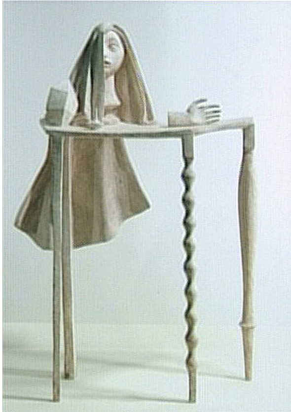
Fig. 4 : Alberto Giacometti, Table , 1933, plâtre 148,5 x 103 x 43 cm.

de manière très plastique. Le corps des personnages beckettien, et implicitement des acteurs, est toujours mis à l'épreuve. Ce n'est quasiment jamais le corps humain dans ses positions naturelles. Comme le remarque aussi Marie Claude Hubert dans son article « Evolution de la mise en scène du corps » 11 , sans faire malheureusement de comparaison avec les arts plastiques, chez Beckett, les corps sont de plus en plus souffrants, et portent les marques de tares profondes. Et, effectivement, l'expressivité de cette douleur qui a laissé son empreinte dans la chair est telle que ces personnages se