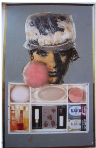
Fig. 9 : Martial Raysse, France Miroir , 1962.