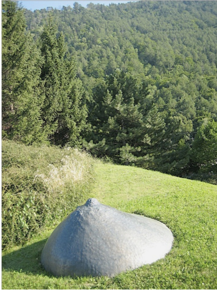
Fig. 2 : César, Sein , 1967, Fondation Giannadda, Suisse.