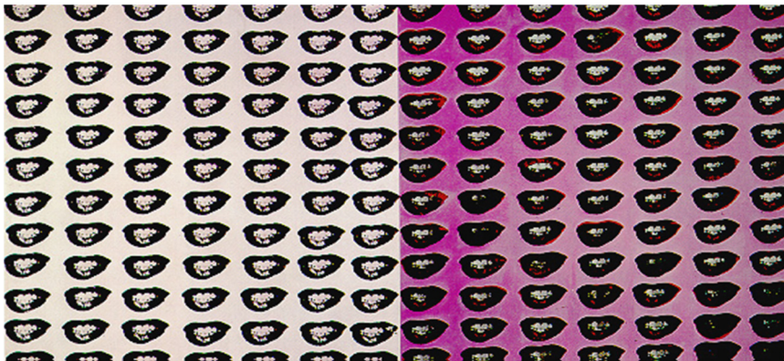
Fig. 11 : Andy Warhol, Marilyn Monroe's lips , 1962.

Regardons aussi un peu Claes Oldenburg et la manière dont il met en scène l'espace et ses objets surdimensionnés (fig. 3), gonflés, qui inversent la relation entre consommateur et objet consommé, l'être moderne étant happé par ceux-ci, à l'exemple du mamelon de terre qui consomme lentement l'être qu'il devrait nourrir (si l'on pense à la fausse « terre nourricière » et aux œuvres métonymiques de César, fig. 2). La bouche de Pas moi , les têtes suspendues dans le noir, à trois mètres du sol, ne fuient-elles pas le réalisme scénique classique, par la transfiguration du banal, tout en restructurant le figuratif d'une manière plastique, en hyperbolisant la forme et en déstructurant les contenus ? La métonymie iconique, cette hyperbolisation d'une partie du corps qui prend sur elle le poids de l'être dans sa totalité, tout en accentuant le vide qui l'accable, que l'on retrouve si souvent chez Andy Warhol et dans le Pop Art (fig. 11), n'est-elle pas aussi une métonymie existentielle chez Beckett : « l'être tout entier... (sus)pendu à ses paroles... » ?