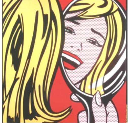
Fig. 6 : Roy Lichtenstein, Girl with mirror , 1964.

En opposition avec l'acte, le tableau, précise Patrice Pavis, dans son Dictionnaire du théâtre , est « une unité spatiale d'ambiance, de caractérisation d'un milieu ou d'une "époque" ; c'est une unité thématique et non actantielle » 14 . En effet, chez Beckett, il n'y a pas de véritable chaîne actantielle dans le sens classique du terme, mais un circuit fermé dans les limites d'un seul cadre avec une forte unité thématique. Pourtant, la caractérisation du milieu et de l'époque se fait bien autrement que par une unité spatiale d'ambiance. Un très bon exemple en ce sens serait le dramacule Catastrophe , que l'auteur dédie à Vaclav Havel. Tout le mouvement se fait du côté du metteur en scène, de son assistant et du technicien des lumières, alors que le Protagoniste, lui, est dans un statisme complet. Afin d'obtenir l'image forte de la catastrophe, après plusieurs essais insatisfaisants, le metteur en scène demande qu'on « coupe l'ambiance » en ne gardant « Rien que la tête. » Le corps du Protagoniste « rentre lentement dans le noir. Seule la tête éclairée. Un temps long. » et M dit :