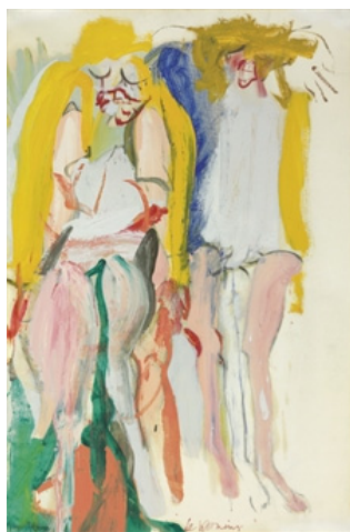
Fig. 8 : De Kooning, Women singing , 1966.

Pourtant, à notre avis, cette étiquette de l'abstraction n'est pas véritablement justifiée. Les personnages beckettien, bien qu'épurés de tout le surplus naturaliste-vraisemblable et ambigus dans leurs rapports sur scène et avec leur spectateur, ont des contours bien précis et concrets. Ils sont là, vivants, dans le cadre emprisonnant de la scène-tableau, espace concentré de leur propre existence à trous et à protubérances.