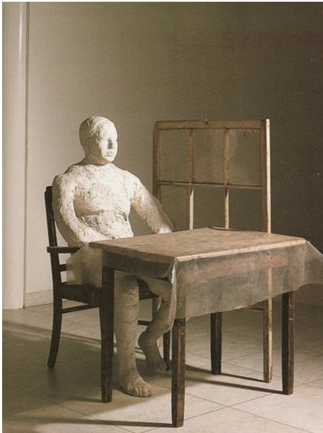
Fig. 1 : George Segal, Man Sitting at a Table , 1961, 134.5 x 122 x 122 cm.

Omniprésente autour des personnages beckettien, l'immobilité est comme une maladie chronique qui paralyse leurs élans physiques et psychiques, c'est le gris, la décrépitude, c'est la mort lente avant la mort définitive, c'est l'impossibilité d'agir, l'action désirée mais interdite, par manque de libre arbitre ou par impuissance acquise. « Nous sommes sur terre, c'est sans remède », disait Hamm dans Fin de Partie , immobilisé dans sa chaise, si semblable aux êtres condamnés au plâtre, conçus par George Segal (fig. 1). Les personnages beckettien n'ont pas le choix : concrètement, Vladimir et Estragon ne peuvent qu'attendre, Pozzo et Lucky ne peuvent que rester liés l'un à l'autre, Clov