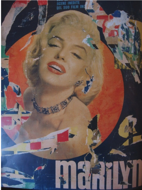
Fig. 5 : Mimmo Rotella, Marilyn , 1963.