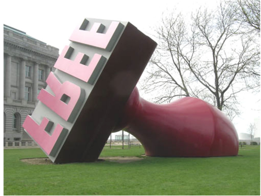
Fig. 3 : Claes Oldenburg, Free Stamp , années 90.

L'immobilité du tableau est interrompue par l'irruption brutale du son dans le paysage initial, qui oblige le personnage à réagir. « Une sonnerie perçante se déclenche, cinq secondes, s'arrête. Winnie ne bouge pas. Sonnerie plus perçante, trois secondes. Winnie se réveille. La sonnerie s'arrête. Elle lève la tête, regarde devant elle. Un temps long. » C'est le deuxième moment d'immobilité et donc deuxième pose du tableau vivant. « Elle se redresse, pose les mains à plat sur le mamelon, rejette la tête en arrière et fixe le zénith. Un temps long. » C'est le troisième moment d'immobilité. Puis elle commence à parler, l'acte est entamé, mais la difficulté et la lutte permanente avec l'échec de mener à bien une action ininterrompue a comme résultat la confrontation du spectateur à une longue alternance de bouts de phrases et de pauses, semblables à une suite d'arrêts sur image (stop cadre) cinématographiques ou à des prises de vues en rafales d'un appareil photographique : « un temps », une action, des paroles, « un temps », etc.