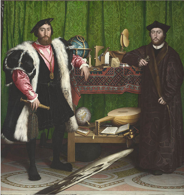
Fig. 1 : http://thedsproject.com/portfolio/deciphering-the-gaze-in-lacans-of-the-gaze-as-objet-petit-a/

Altman lui-même utilise l'image anamorphique jusqu'aux années '80, y renonçant, selon ses propres paroles, seulement lorsqu'il s'est rendu compte que ses films seraient vus aussi sur de petits écrans: « But I liked the anamorphic image because I believe that's the way I believe you see. Now I'm kind of blind on one side but looking at you, I'm really seeing that shape. » 9 Plus encore, avec ses opérateurs, Altman avait l'habitude d'obtenir un effet de brouillard sur la pellicule par une technique de la surexposition, comme par exemple les images embrumées de McCabe et Madame Miller ,