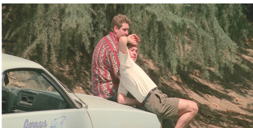
Fig. 5 & 6 : https://www.listal.com/viewimage/8391816 https://www.listal.com/viewimage/15428512

La fin de Short Cuts se situe entre les deux approches de Buñuel, parce que l'acte meurtrier gratuit, doublé d'un tremblement de terre dans la vie de tous les personnages, semble illustrer la paranoïa structurelle qui suppose la forclusion psychique, de même qu'un passage à l'acte qui permet la restructuration symbolique du sujet. De toute manière, la scène du tremblement de terre qui interrompt les soliloques symptomatiques des personnages et qui permet à la fois l'acte meurtrier est symptomatique pour cette paranoïa