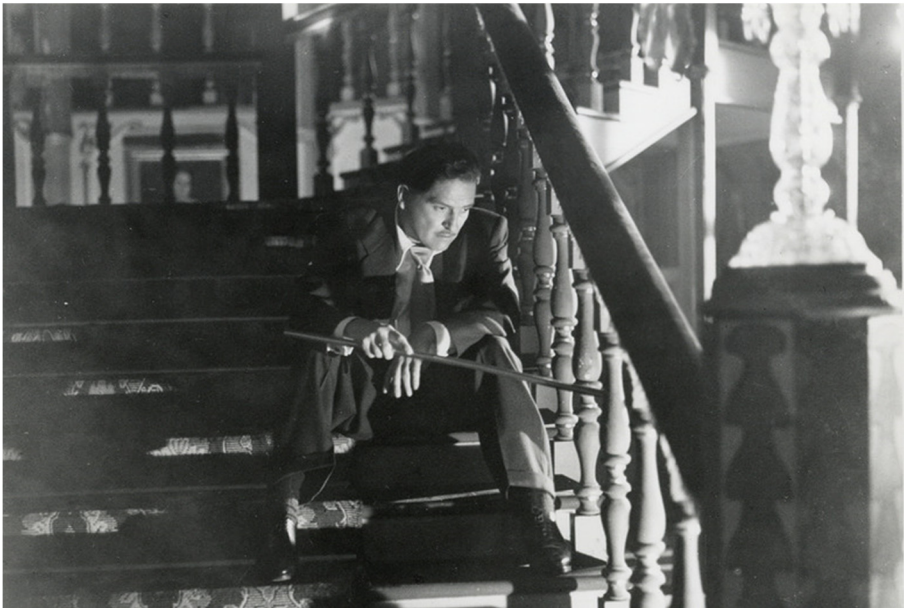
Fig. 4 : https://www.moma.org/calendar/events/3646