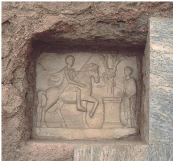
Abbildung 4: Ephesos, Hanghaus 2, Wohneinheit 2; Votivnische.

Das Relief (Abbildung 4) zeigt den Schutzgeist in Gestalt einer Schlange und davor einen Altar, der die religiös-kultische Funktion der Nische verdeutlicht. 5 Dieser Schutzgeist konnte aber nicht nur durch die Trankspende, sondern auch auf andere Weise in ein Festmahl einbezogen werden: Man konnte ihm auch vom Festmahl bestimmte Teile der Speisen in der Nische niederlegen, zumal das Relief ja nicht zufällig auch die Darstellung eines Altars enthielt. Auf diese Weise konnte man den Schutzgeist symbolisch am Mahl des Hauses teilhaben lassen. Dann gab es eine Art Mahlgemeinschaft der Mahlteilnehmer im Speiseraum des Hauses mit dem Schutzdämon.