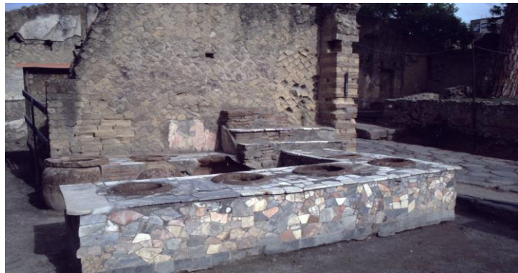
Abbildung 1: Garküche in Herculaneum; 1.Jh. n.Chr.

In einer solchen Garküche, wie sie z.B. in Herculaneum ausgegraben worden ist (Abbildung 1), gab es warme Fischsuppe oder einen Linsen- oder Gemüseeintopf. Das wurde im Vorübergehen verzehrt, und mit religiösen Elementen ist hier nicht zu rechnen. Bei aufwendigeren Mahlzeiten war das dagegen anders. Man kann diese Mahlzeiten in drei Gruppen unterteilen: einerseits private Gastmähler, sodann öffentliche Kultmähler und schließlich, zwischen diesen beiden angesiedelt, halböffentliche religiöse Vereinsmähler.