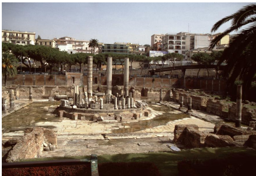
Abbildung 10: Puteoli, macellum ; 2.Hälfte des 1.Jh. n.Chr..

Das macellum war ein Ort der gehobenen Einkaufskultur. 31 Es handelte sich nicht um einen offenen Marktplatz mit beweglichen Marktständen, sondern um ein geschlossenes Gebäude mit Innenhof, von dem aus die fest eingebauten Läden zugänglich waren (vgl. Abbildung 10). 32