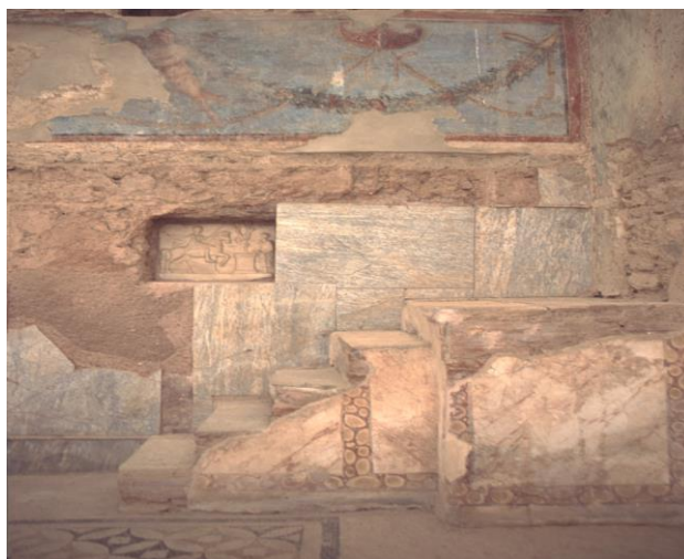
Abbildung 3: Ephesos, Hanghaus 2, Wohneinheit 2; Erdgeschoss, Treppe mit Votivnische; 1./2.Jh. n.Chr. (Foto: D.-A. Koch).

Die Bedeutung des Agathos Daimon ist in dem gut erhaltenen sog. Hanghaus 2 in Ephesos (1./2.Jh. n.Chr.) 4 klar zu erkennen (vgl. Abbildung 3).