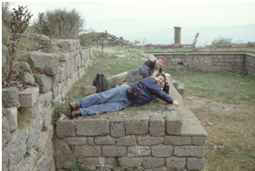
Abbildung 7: Pergamon, Podiensaal; Position der Mahlteilnehmer 17.

Der Raum selbst ist auch baulich im Blick auf die Durchführung eines religiösen Festmahls geplant: Gegenüber dem Eingang befindet sich eine Nische, außerdem ist innerhalb des Raums bei Ausgrabungen ein Altar gefunden worden. Dabei ist nicht sicher, wo genau dieser Altar innerhalb dieses Raums stand. Ein möglicher Standort ist natürlich die Nische gegenüber dem Eingang, denkbar ist aber auch, dass sich dort ein Standbild der Gottheit befand und der Altar in der Raummitte stand. Auf jeden Fall zeigt der Altar, dass hier geopfert wurde, und zwar im Rahmen eines Vereinsmahls. D.h. die Gottheit wurde dann so bewirtet, wie auch die Mahlteilnehmer bewirtet wurden. Man aß also in Gemeinschaft mit der Gottheit.