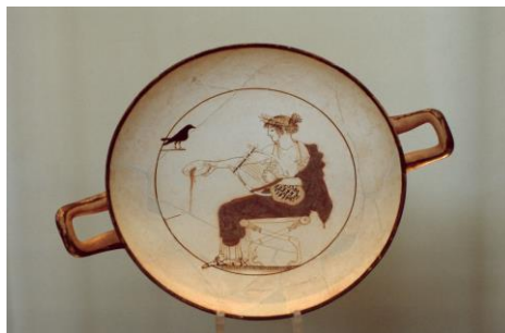
Abbildung 2: Trinkschale; Apollon bringt eine Trankspende dar; Delphi, 480/470 v.Chr.; Archäologisches Museum (Foto: D.-A. Koch).

Die Anlässe für private Gastmähler konnten vielfältig sein, in erster Linie natürlich Familienereignisse, wie Geburt, Hochzeit und Tod, doch gab es auch andere Anlässe, beruflicher oder geselliger Art. Ein solches Festmahl hatte einen klaren religiösen Bezug: Zum Mahl gehörte eine Trankspende (griechisch: spondé , lateinisch: libatio ). Eine schöne Veranschaulichung bietet eine Trinkschale aus Delphi (Abbildung 2).