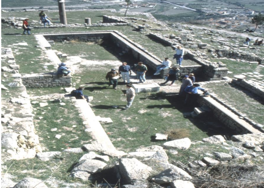
Abbildung 6: Pergamon, Akropolis, Podiensaal; 2.–4. Jh. n.Chr. (Foto: D.-A. Koch).

Es ist ein 24 m x 10 m großes Gebäude, das mit Liegepodien ausgestattet ist. Wie beim Bankettraum in Kourion ist hier eine \Pi -förmige Konstruktion gewählt, allerdings in Querlage, wobei zwei \Pi -förmigen Podien aneinander stoßen und einen gemeinsamen Raum bilden. Hier konnten sicher alle Vereinsmitglieder gleichzeitig am Mahl teilnehmen. 15 Auch hier lagen die Mahlteilnehmer auf den erhöhten Podien (natürlich auf Decken und Kissen), und zwar mit den Füßen zur Rückwand des Gebäudes und dem Kopf nach innen, gestützt auf den linken Arm, während man mit der Rechten die Speisen zu sich nahm (vgl. Abbildung 7). 16