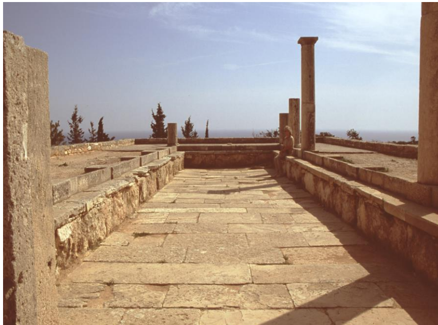
Abbildung 5: Kourion (Zypern), Heiligtum des Apollon Alyattes; Bankettraum.

Die hohe Bedeutung des gemeinsamen Kultmahls kann man dort erkennen, wo sogar für die gesamte Teilnehmerschaft eigene Gebäude zur Durchführung der Opfermähler errichtet worden. Ein beeindruckendes Beispiel befindet sich auf Zypern, in Kourion an der Südküste der Insel. Einige Kilometer außerhalb der Stadt gab es dort eine Art Wallfahrtsheiligtum, einen Kultkomplex für Apollon Hylates. 11 Zu dem Heiligtum gehörten neben dem Tempelgebäude auch fünf nebeneinander liegende Gebäude, alle mit dem gleichen Π-förmigen Grundriss. Der Innenraum dieser Gebäude (Abbildung 5) ist 16 m lang und 9,60 m breit. Er besteht aus zwei Elementen: einem Π-förmigen erhöhten Podium von 3 m Breite, wobei es vor den Podien ein umlaufendes etwas tiefer gelegenes Bord gibt. Zwischen den Podien befindet sich ein tieferer Bereich von 3,60 m Breite. Das Ganze war überdacht. Man war also vor der Sonne geschützt.