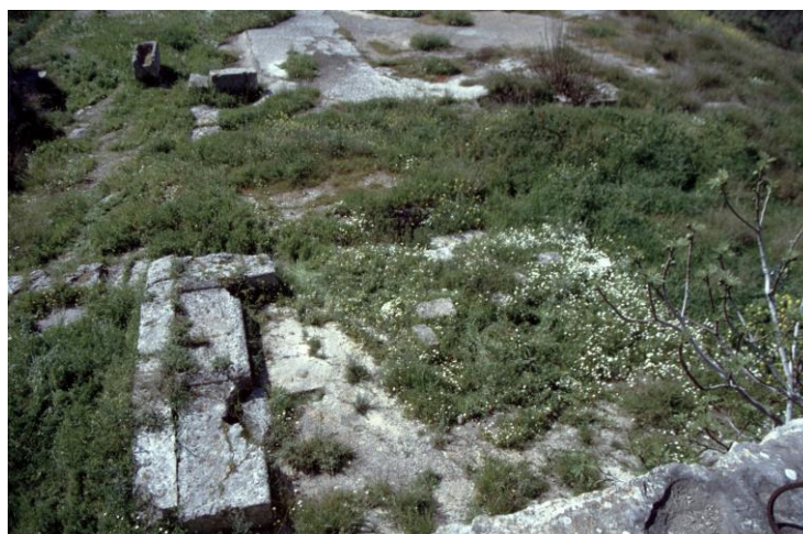
Abbildung 9: Asklepieion von Korinth; Speiseraum mit Liegebänken.

Die Speiseräume selbst hatten einen quadratischen Grundriss von etwa 6,40 Kantenlänge, sie waren von Innenhof zugänglich und mit 11 fest eingebauten steinernen Liegebänken ausgestattet, von denen einige Reste noch erhalten sind (Abbildung 9). 20